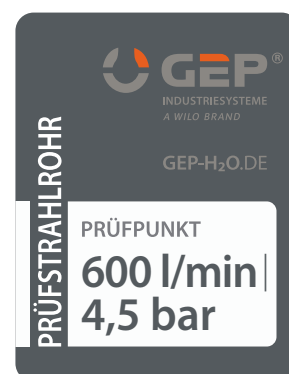
Einleger Prüfpunkt (vergrößerte Darstellung).

Alle Angaben ohne Gewähr, vorbehaltlich Änderungen.