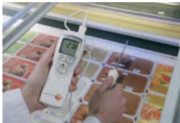
Lufttemperatur-Messung an Kühlvitrinen und Gefriertruhen