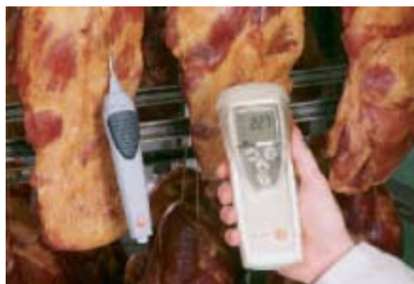
Kerntemperatur-Bestimmung beim Räuchervorgang, kabellos, Messdatenübertragung per Funk