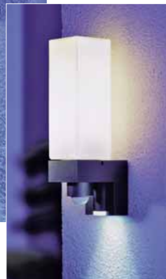
L 266 cube alu-anthrazit Opal, matt