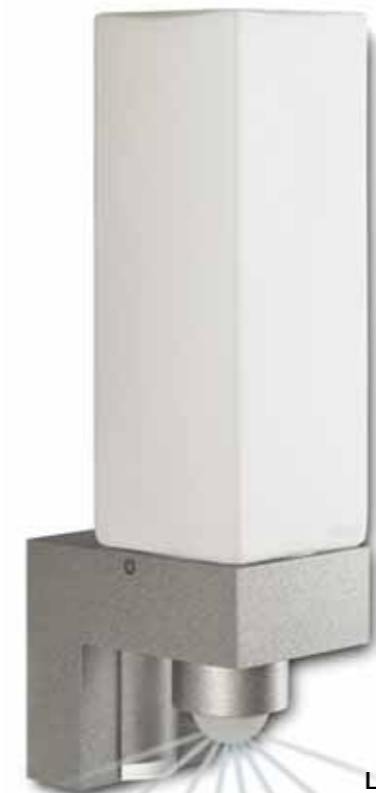
L 266 cube alu-silber Opal, matt

PEWA Messtechnik GmbH Weidenweg 21 58239 Schwerte Tel.: 02304-96109-0 Fax: 02304-96109-88 E-Mail: info@pewa.de Homepage : www.pewa .de