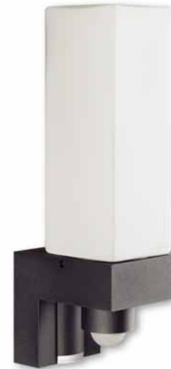
L 266 cube alu-anthrazit Opal, matt