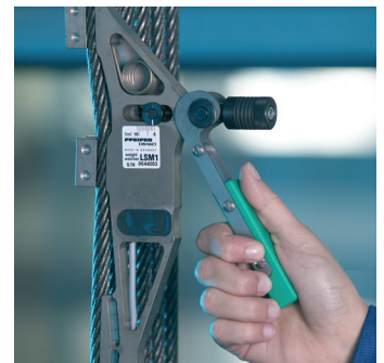
Sensoren am Seil fixiert