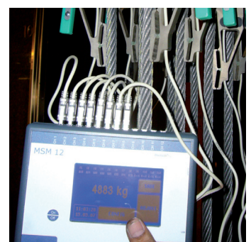
Ablesen der Daten mit dem Assistenten MSM 12