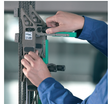
Öffnen der Sensoren zur Anbringung