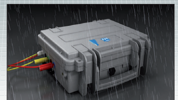
PQA820 im robusten Koffer (IP65)