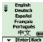
Wählen Sie Ihre Sprache.