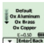
Wählen Sie die zu messende Oberfläche.