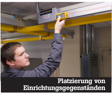
Platzierung von Einrichtungsgegenständen