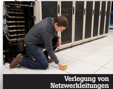
Verlegung von Netzwerkleitungen