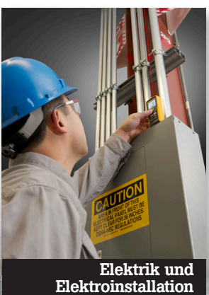
Elektrik und Elektroinstallation