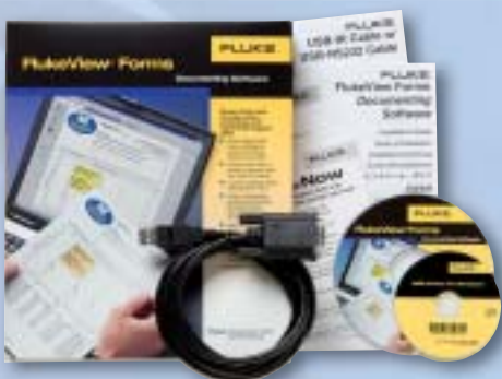
FlukeView® Forms Software und IR/USB-Kabel