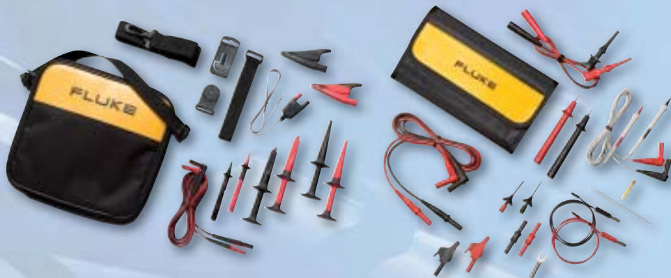
TLK289 Messleitungssatz für Industrieanwendungen

Es steht umfangreiches Zubehör zur Verfügung, mit dem die Vielseitigkeit der Messgeräte Fluke 289 und 287 noch gesteigert werden kann. Das folgende Zubehör ist für die meisten Benutzer besonders wichtig.