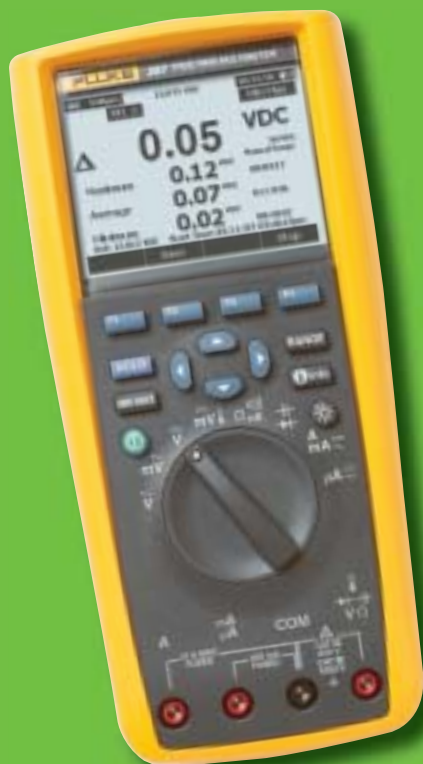
Transfer von Daten zum PC mit IR/USB-Schnittstellenkabel und Software FlukeView Forms (Optionen)

Die Fehlersuchfunktionen, die Auflösung und die Genauigkeit machen das Digitalmultimeter Fluke 289 zum idealen Messgerät für anspruchsvolle Anwendungen. Es bietet Funktionen zur Ermittlung von Problemen in Motorantriebssteuerungen, in der Prozessautomation, in der Energieverteilung und in elektromechanischen Anlagen. Mit den Digitalmultimetern Fluke 287 und 289 führen Sie Messungen durch und zeichnen die Messdaten auf. Danach können die Messdaten als Zahlenwerte oder als Trendkurve auf dem Messgerät angezeigt werden, ohne dass die Daten auf einen PC übertragen werden müssen.