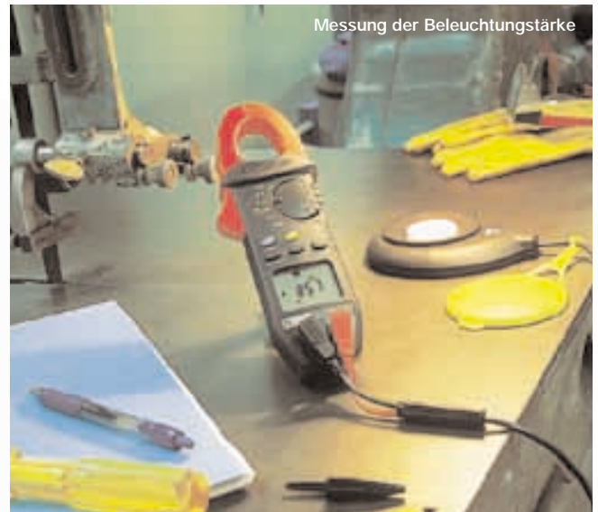
Messung der Beleuchtungsstärke

Ebenso können die Geräte im Modus DC-Amperemeter den Nullabgleich bei Gleichstrommessung (DC Zero) durch einfachen Tastendruck automatisch durchführen. Der Schutz des Benutzers wird über die in die Zange integrierte Funktion V-live sichergestellt: Der Summer wird bei Spannungsmessungen ausgelöst, wenn eine als gefährlich erachtete Spannung mit einem Spitzenwert von mehr als 45 V festgestellt wird.