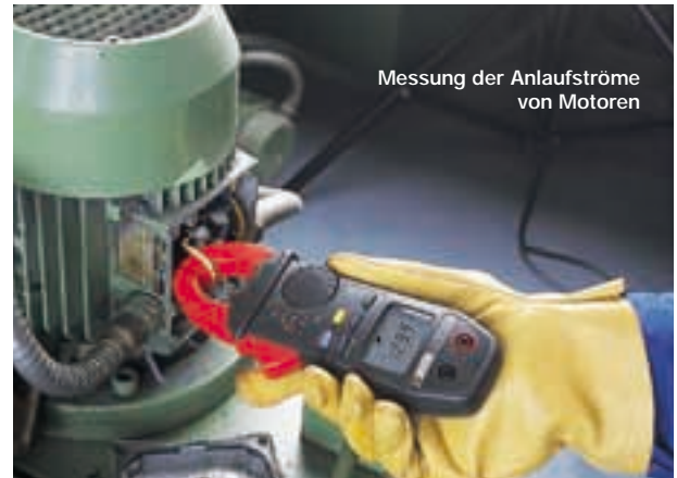
Messung der Anlaufströme von Motoren

Die Funktion Inrush Current ermöglicht eine Analyse von Motor-Einschaltströmen, ohne dass eine grafische Darstellung erfolgen muss, und bestimmt das Verhältnis Amplitude/Zeit des Motorschutzes.