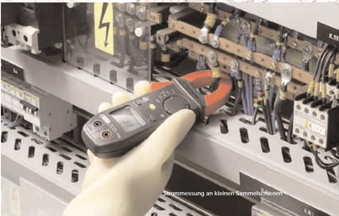
Strommessung an kleinen Sammelschienen

Jede der Zangen wählt automatisch die Art des zu messenden Signals (AC oder DC) sowie den Messbereich (Autorange), natürlich ist aber auch ein manueller Betrieb möglich.