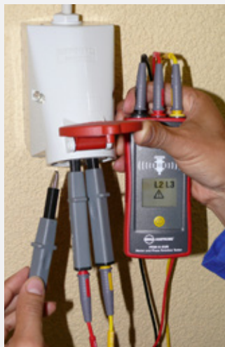
Überprüfung von Steckdosenverkabelung