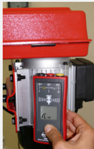
Kabellose Prüfung der Motor-Drehrichtung