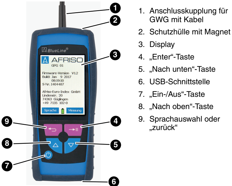
Abbildung 1: Übersicht Grenzwertgeberprüfgerät