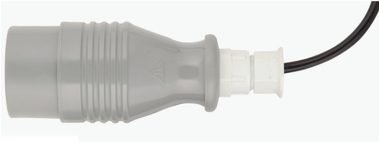
Abbildung 2: Anschlusskupplung 903 für Grenzwertgeber